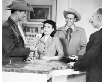
1957 SLIM CARTER (Slim Carter) de Richard Bartlett avec Jock Mahoney, Julie Adams