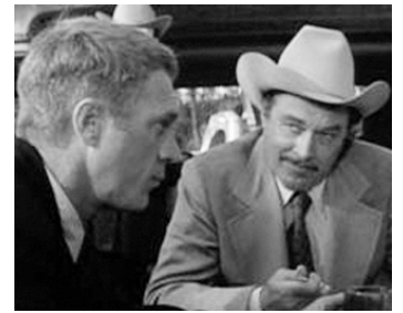
1972 LE GUET-APENS (The Getaway) de Sam Peckinpah avec Steve McQueen