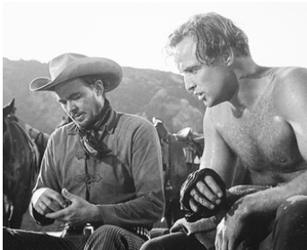
1960 LA VENGEANCE AUX DEUX VISAGES (One-Eyed Jack) de et avec Marlon Brando