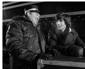
1980 LE MONSTRE DU TRAIN (Terror Train) de Roger Spottiswoode avec David Copperfield