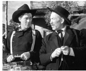
1950 LE CONVOI DES BRAVES (Wagon Master) de John Ford avec Ward Bond