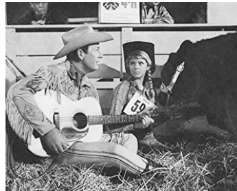
1961 TOMBOY AND THE CHAMP de Francis D. Lyon avec Candy Moore