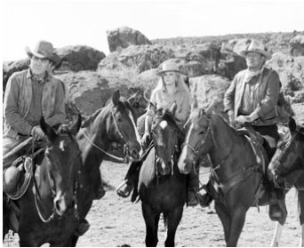
1972 LES VOLEURS DE TRAINS (The Train Robbers) de Burt Kennedy avec Ann-Margret, John Wayne