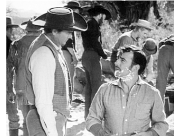
1960 TEN WHO DARED de William Beaudine avec James Drury