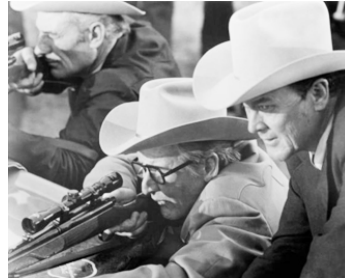
1973 SUGARLAND EXPRESS (The Sugarland Express) de S. Spielberg avec Gregory Walcott