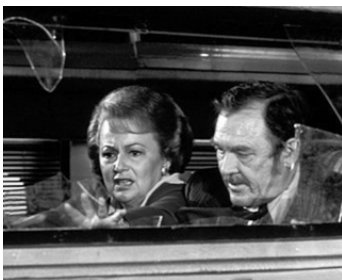
1977 L'INÉVITABLE CATASTROPHE (The Swarm) d' Irwin Allen avec Olivia de Havilland