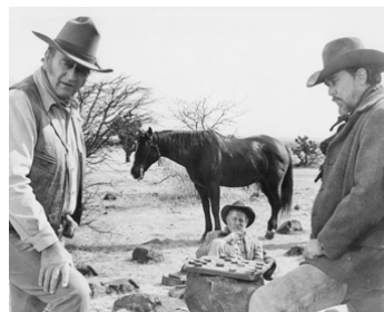
1969 LES GÉANTS DE L'OUEST (The Undeclared) d'A. McLaglen avec John Wayne, H. Carey Jr