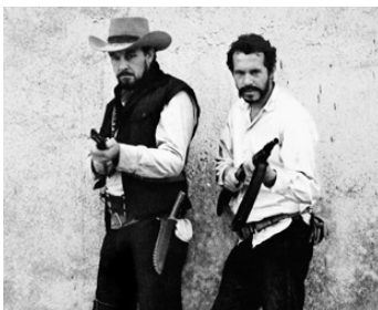
1969 LA HORDE SAUVAGE (The Wild Bunch) de Sam Peckinpah avec Warren Oates