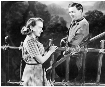
1949 MONSIEUR JOE (Mighty Joe Young) d'Ernest B. Schoedsack avec Terry Moore