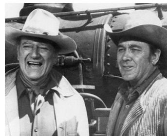
1970 CHISUM (Chisum) d'Andrew V. McLaglen avec John Wayne