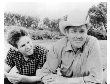
1970 LA DERNIÈRE SÉANCE (The last picture show) de Peter Bogdanovich avec Jeff Bridges