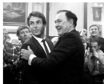
1986 SIX HOMMES POUR TUER HARRY (Let's get Harry) de Stuart Rosenberg avec Mark Harmon