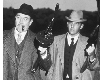
1973 DILLINGER (Dillinger) de John Milius avec Steve Kanaly