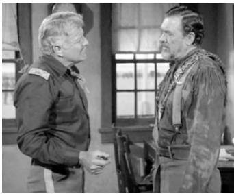
1971 RIO VERDE (Something Big) d' Andrew V. McLaglen avec Brian Keith