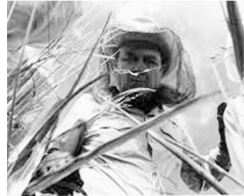
1976 QUAND LES ABEILLES ATTAQUENT (The Savage Bees) de Bruce Geller