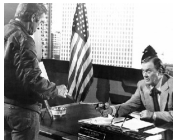
1980 LE CHASSEUR (The Hunter) de Buzz Kulik avec Steve McQueen