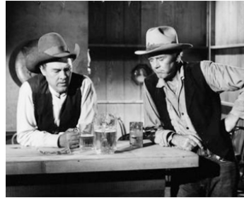
1972 LE PONEY ROUGE (The Red Pony) de Robert Totten avec Henry Fonda