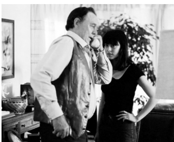
1982 TEX (Tex) de Tim Hunter avec Cloris Leachman