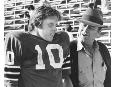
1973 BLOODSPORT (Bloodsport) de Jerrold Freeman avec Gary Busey