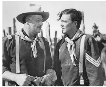
1949 LA CHARGE HÉROÏQUE (She wore a yellow ribbon) de John Ford avec John Wayne