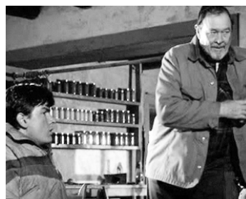
1984 L'AUBE ROUGE (Red Dawn) de John Milius avec Charlie Sheen