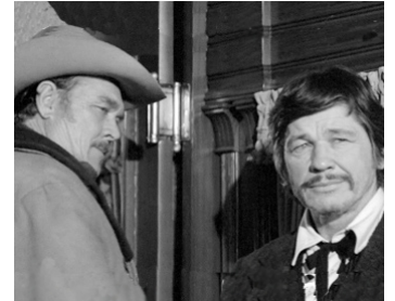
1975 LE SOLITAIRE DE FORT HUMBOLT (Breakheart Pass) de Tom Gries avec Charles Bronson