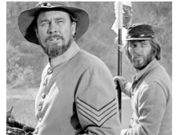
1964 MAJOR DUNDEE (Major Dundee) de Sam Peckinpah avec L. Q. Jones