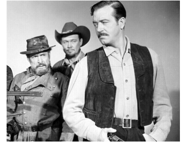
1956 JE TE VENGERAI, MON FILS (Rebel in Town) d'A. Werker avec J. Carrol Naish, John Payne