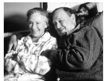
1996 ÉTOILE DU SOIR (The Evening Star) de Robert Harlin avec Marion Ross