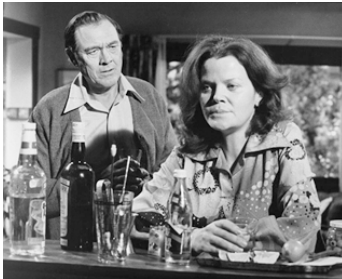
1975 LA CITÉ DES DANGERS (Hustle) de Robert Aldrich avec Eileen Brennan