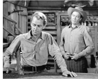
1952 L'HOMME DES VALLÉES PERDUES (Shane) de George Stevens avec Alan Ladd