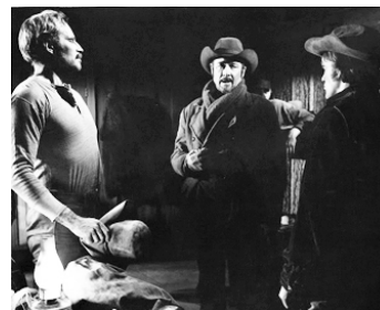
1967 WILL PENNY LE SOLITAIRE (Will Penny) de Tom Gries avec Charlton Heston