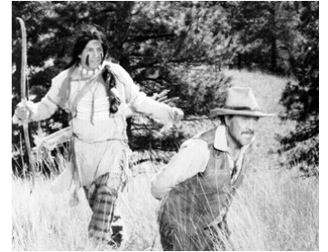
1977 DUEL À CHEYENNE PASS (Grayeagle) de Charles B. Pierce avec Iron Eyes Cody