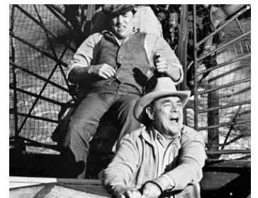
1981 SOGGY BOTTOM USA de Theodore J. Flicker avec Dub Taylor