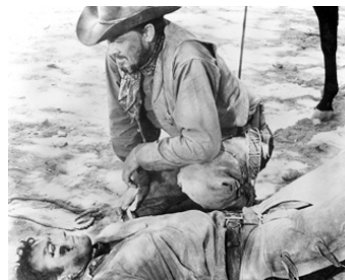
1966 PENEZ-LES HAUT ET COURT (Hang'em high) de Ted Post avec Clint Eastwood