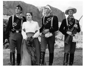
1950 RIO GRANDE de John Ford avec Maureen O'Hara, Claude Jarman Jr, Hary Carey Jr