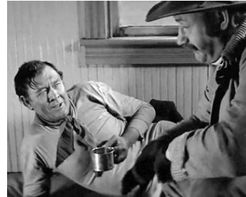
1974 LA CHEVAUCHÉE SAUVAGE (Bite the Bullet) de Richard Brooks avec Gene Hackman