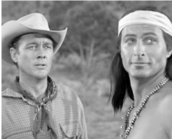
1956 LES TAMBOURS DE LA GUERRE (War Drums) de Reginald Le Borg avec Lex Barker