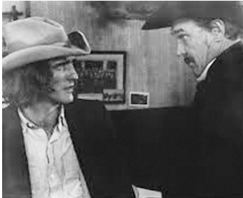
1973 KID BLUE (Kid Blue) de James Frawley avec Dennis Hopper