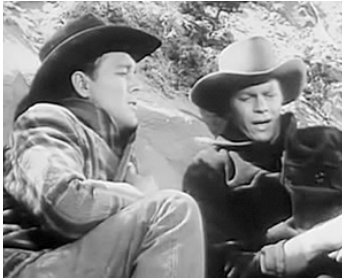
1951 LE FORT DE LA VENGEANCE (Fort Defiance) de John Rawlins avec Dane Clark