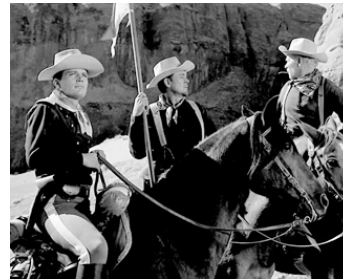
1963 LES CHEYENNES (Cheyenne Autumn) de John Ford avec Patrick Wayne, Harry Carey Jr