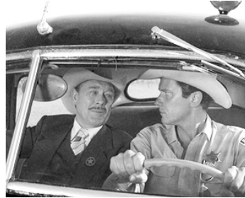
1976 THE TOWN THAT DREADED SUNDOWN de Charles B. Pierce avec Andrew Pine